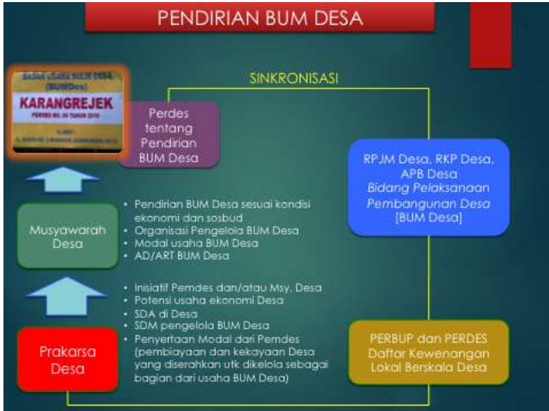
Gambar 4. PENDIRIAN BUM Desa

juga mencantumkan BUM Desa dalam perencanaan bidang pelaksanaan pembangunan Desa (item: rencana kegiatan pengembangan usaha ekonomi produktif).