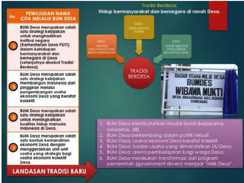
Gambar 2. BUM DESA, NAWACITA DAN TRADISI BERDESA