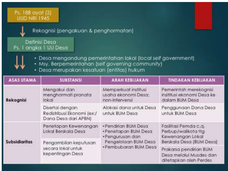
Gambar 3. ASAS REKOGNISI-SUBSIDIARITAS BUM Desa